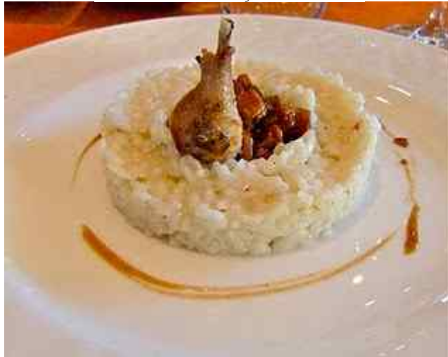
La quaglia incontra il Carnaroli vercellese. Vaktel i en noe bløtere risotto der kun en mikroskopisk kjerne føltes "al dente". Raguen er saftig mens låret er noe tørt. Ikke min risotto dette.