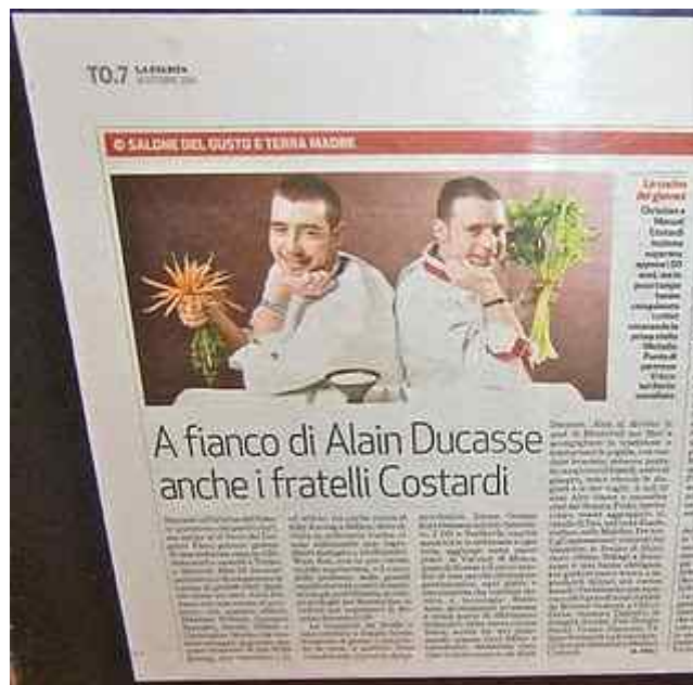
Den italienske avisen La Stampa plasserer brødrene på "flanken" til Alain Ducasse . . .

Veggpyrden på hotellet viser med all tydelighet hva som er kjøkkenets hovedingrediens. Siden dyrkingen av ris rundt Vercelli startet i ca. 1475 har man valgt å dele risen inn i fire kategorier basert på riskornenes størrelse: comune, semifino, fino og superfino. Koketiden varierer fra 12-13 min for comune til 16-18 min for superfino. Superfino er mest brukt til risotto, med Arborio (type) mest brukt utenfor Italia. På hotellet som ellers i omegnen bruker de Carnaroli, først dyrket på 1950-tallet. Andre populære typer er Baldo og Vialone Nano.