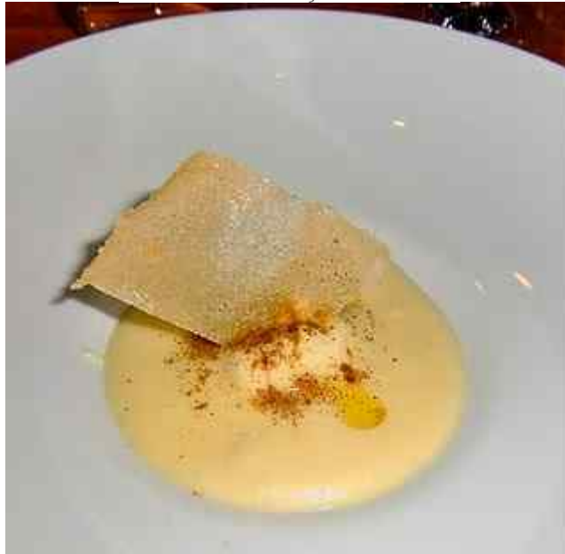
Patata e uovo. En ekstra rett like perfekt som beskrevet tidligere.