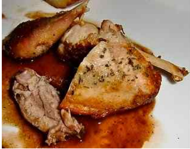
Pernice marinata in olio extra vergine, salsa barbera, aromatizzato patate ratte. Perlehøne og nedkokt barberavin. Ofte for tørr og det samme skjedde her. Grei rett, men ikke noe mer.