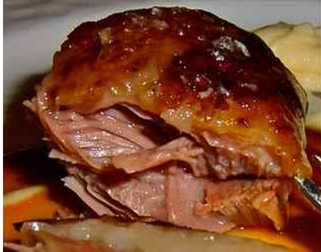
Bildet taler vel for seg selv.