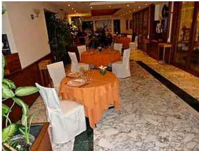
Lyst og trivelig lokale med en * eleganse.