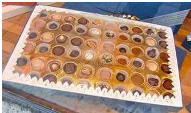
Litt info om Pasticceria Follis HER