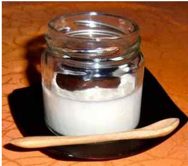
Panna cotta morbida e Saba. Kunsten er å få den flytende, men likevel svakt fast i fisken. Litt juks å servere den i glass:) Perfekt ren smak av melk/fløte smaksatt med nedkokt druemost på toppen. Langt fra den norske varianten som ofte krever motorsag . . .