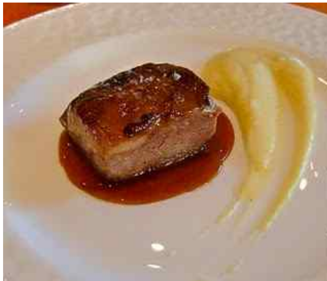
Guancia di vitello Macelleria Cazzamali in cottura lenta sottovuoto a 65 ° C accompagnata dal suo ristretto e da un morbido di patata. Vi beveger oss utenfor hodet på kalven og angriper kjakene. I år har det blitt oksekjaker, hestekjaker og sauekjaker. Nå kalvekjaker som har vært et døgn i ovnen før en omgang under grillen. Det karamelliserte fettlaget på toppen minner om foie gras i teksturen. Sausen er kraft fra kjakene konsentrert til "ristretto". En luftig potetpure ved siden av. Her utdeles prisen for årets stykke kjøtt 2010!