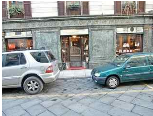
Prøv Pasticceria Follis i Corso Liberta. På topp siden 1904.